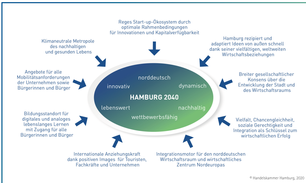
Abbildung 3: Zielbild Hamburg 2040