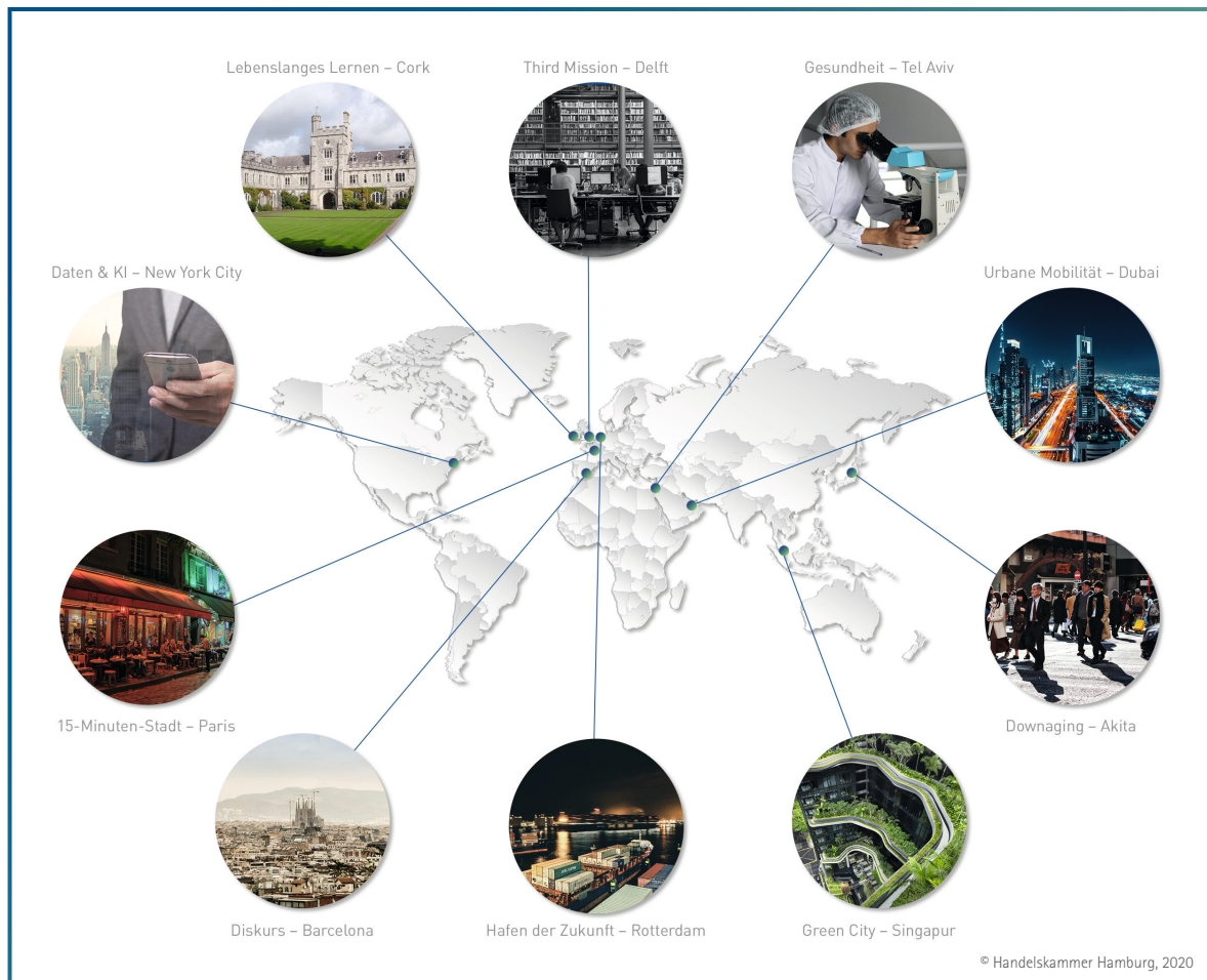
Abbildung 4: Trend-Citys im Überblick

Vor diesem Hintergrund sieht die Handelskammer folgende Themen für eine erfolgreiche Zukunft des Standorts Hamburg als zentral an: